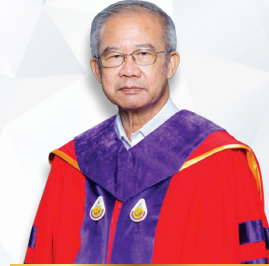
พลตำรวจตรีสุรศักดิ์ จ้อยจำรูญ